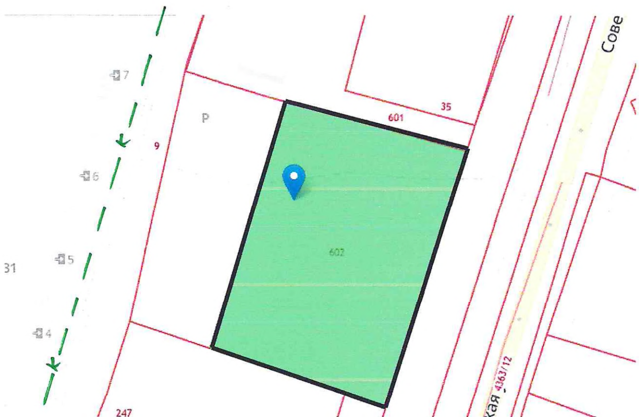
Схема границ земельного участка по адресу: Российская Федерация, Архангельская область, Вельский муниципальный район, Вельское городское поселение, город Вельск, улица Советская, д. 21, с кадастровым номером 29:01:190114:602